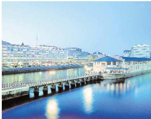
Один из самых востребованных инсентив отелей Женева — Mandarin Oriental Hotel Du Rhone

6500 человек, а суммарно здесь может находиться одновременно до 9500 человек.